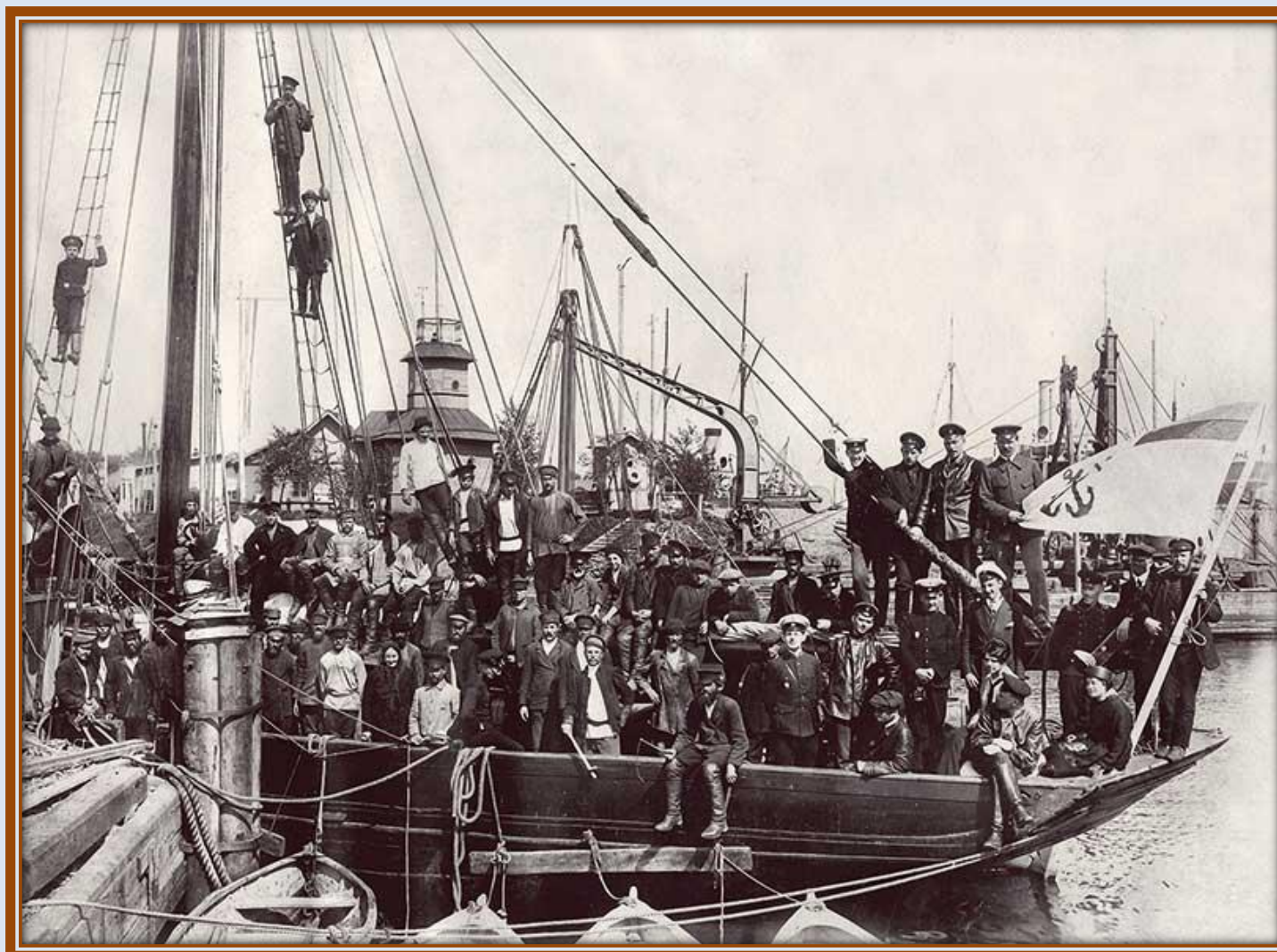
Экспедиция Управления Мурманских портовых изысканий перед отправлением из Архангельска на яхте «Любовь». 1916 год