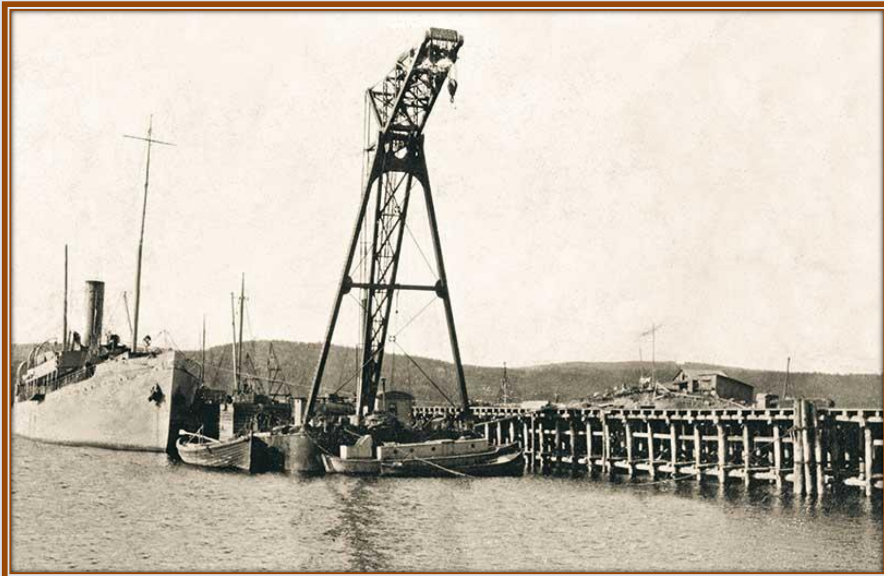
Первые временные причалы Мурманского порта. 1916 год